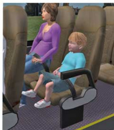
Trasporto bambini su autobus dotati di cinture di sicurezza